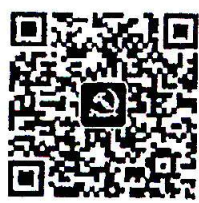
共产党员微信 二维码